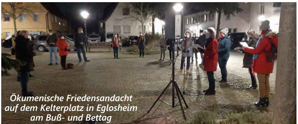
Ökumenische Friedensandacht auf dem Kelterplatz in Eglosheim am Buß- und Betttag